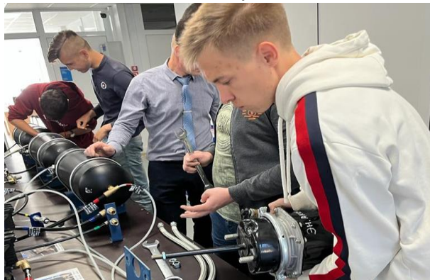
для 29 студентов проведены лабораторно-практические работы