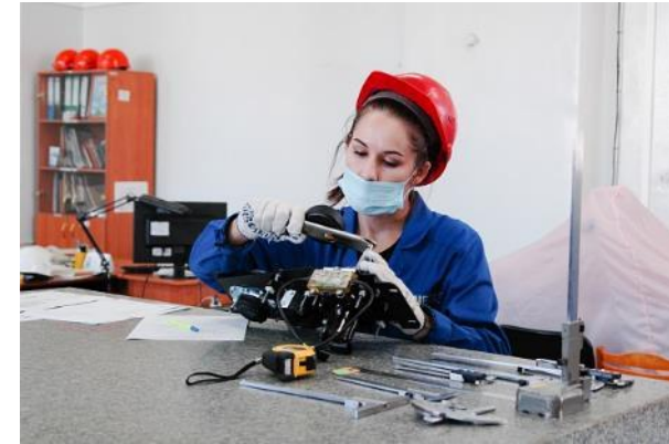
383 студента прошли производственную практику