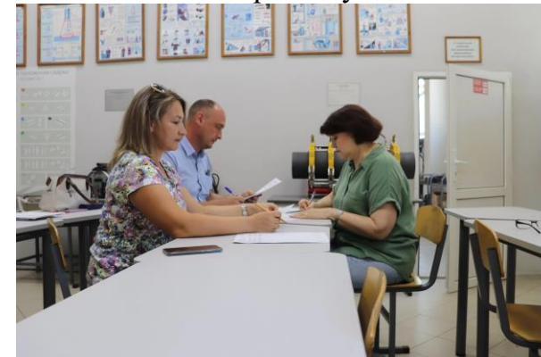
Ежегодно, сотрудники завода занимаются дипломным проектированием, принимают участие в ГИА