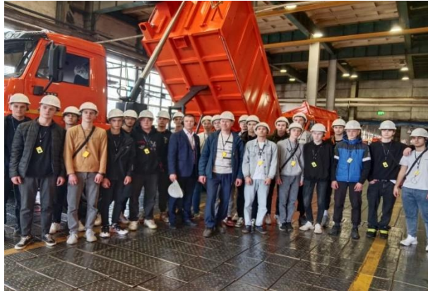
для 294 студентов проведены экскурсии по заводу